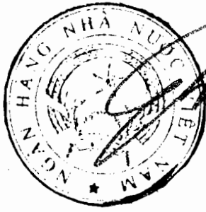
Nguyễn Văn Bình

THÔNG ĐỐC NGÂN HÀNG NHÀ NƯỚC TỔNG THANH TRA CHÍNH PHỦ